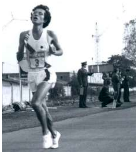
Takeshi So na trati MMM 1976

Okrem spomienky a pohľadu do histórie to boli a sú i študenti stredných škôl, ktorí sa snažia každoročne kvalifikovať do finálnej štafety nesúcej meno jednej z legiend. Takéto kvalifikačné behy boli odštartované už aj v tomto roku, konkrétne v Michalovciach 6. júna. Nasledovať budú ďalšie miesta na východnom Slovensku tak, aby sa v nedeľu 2. októbra na slávnú maratónsku trať v stopách Takeshi So vydalo 42 mladých ľudí z celého regiónu.