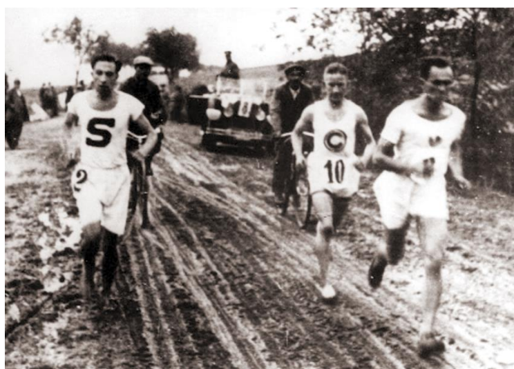
FOTO PRAVEK KOŠICKÉHO MARATÓNU

28. októbra 1924 si neznámy autor pod zručaninou hradu v Turni zoradil 8 bežcov a zopár organizátorov, aby vyhotovil prvý záber Košického maratónu. Stal sa slávnym a bol nespočetne krát publikovaný. Potom ich vznikli tisíce, s nástupom digitálnej doby určite milióny. Napriek všetkému, čomu dnes svet holduje, retro témy lákajú. Lákajú i historické fotografie odrážajúce dianie na košickej trati v dobách maratónskeho praveku. Keď pred časom uzrela svetlo sveta fotovýstava „90 rokov košického maratónu vo fotografii“, jej návštevníci v Košiciach, Prahe, Krakove, či Berlíne najviac upierali zrak práve na tie najstaršie zábery. Stále sa preto vynára otázka. Existujú i ďalšie? Mali vtedajší nadšenci a fanúšikovia maratónu možnosť fotiť pre svoje vlastné archívy vo väčšej miere než sa domnievame? Na túto otázku môžu dnes dať odpoveď ich deti, či vnuci. Porozhľadajte sa preto po albumoch,